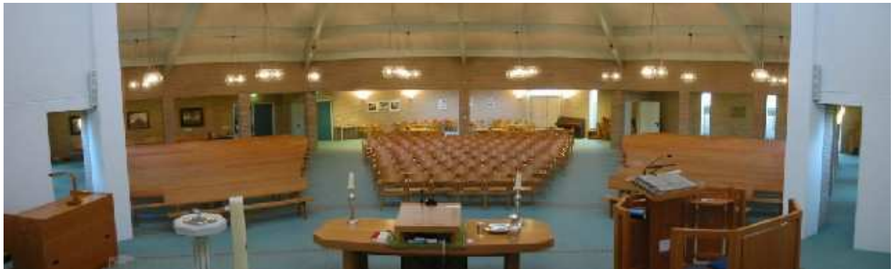
Kerkzaal gezien vanaf het liturgisch centrum