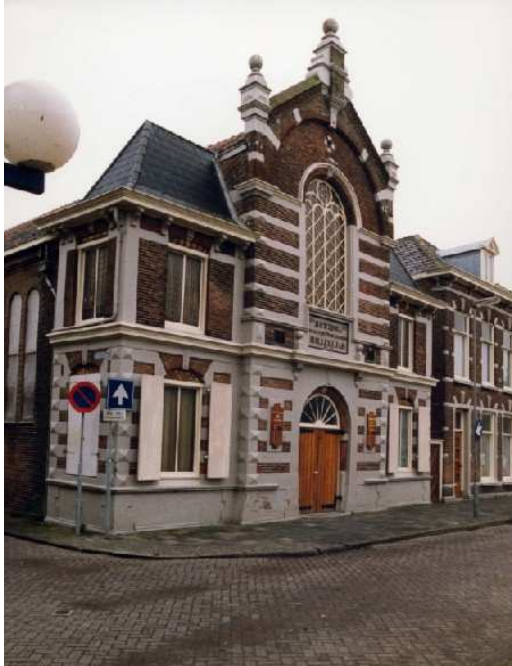
Bethelkerk met pastorie, voorzijde

De Gereformeerde Kerk te Den Helder dateert van 1840 en heeft sindsdien diverse gebouwen in bezit gehad, te beginnen met de eerste Bethelkerk aan de (oude) Kanaalweg. In 1889 verrees aan de spoorstraat een tweede kerk, de Zuiderkerk. Na een grondige verbouwing en het afstoten van de kerk aan de Kanaalweg kreeg de Zuiderkerk de naam Bethelkerk.